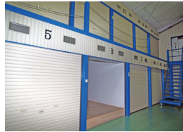
個室に仕切られた収納ルーム